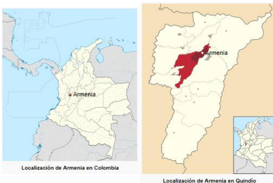
Ilustración 2 Ubicación Geográfica Municipio de Armenia

Armenia, una ciudad pujante e innovadora que le apuesta a resurgir luego de una experiencia de desastre natural, preparándose para afrontar situaciones de crisis, mediante comunidades, instituciones y organismos del estado más resilientes.