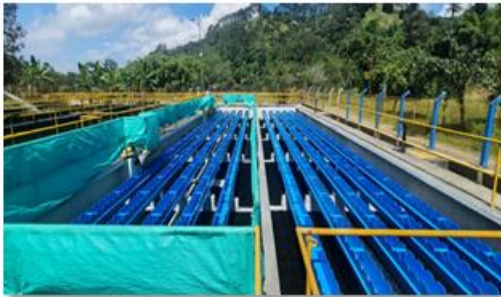
Foto 2. Reposición de los tubos de recolección y placas paralelas - Desarenadores Primarios - Unidad 1 (Fase I) Obra N° 006-2021