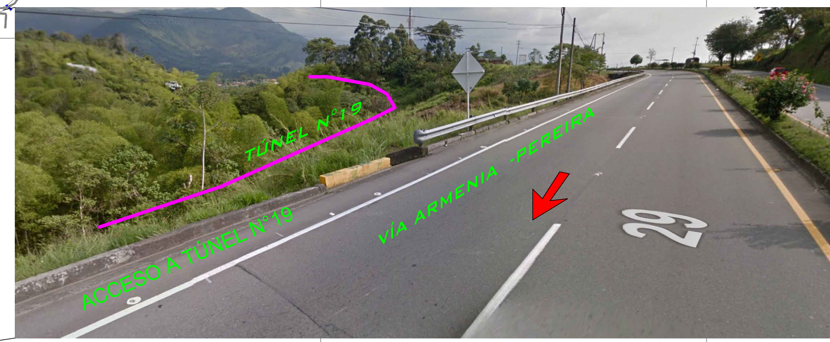
IMAGEN DE LOCALIZACIÓN DEL TUNEL N°19 DESDE LA VÍA ARMENIA - PEREIRA