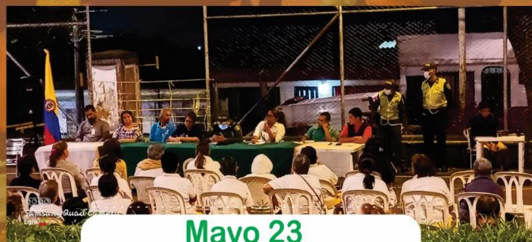
Mayo 23 Barrio Belencito