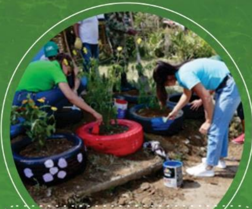
Febrero 22 Barrio Quintas de los Andes

Se realizan actividades de recuperación y/o adecuación en los puntos críticos que se están generando en algunos barrios. Es de resaltar que esta intervención se realiza a partir del aprovechamiento y recuperación de un residuo especial como son las llantas usadas, adicional se realiza socialización con la comunidad intervenida.