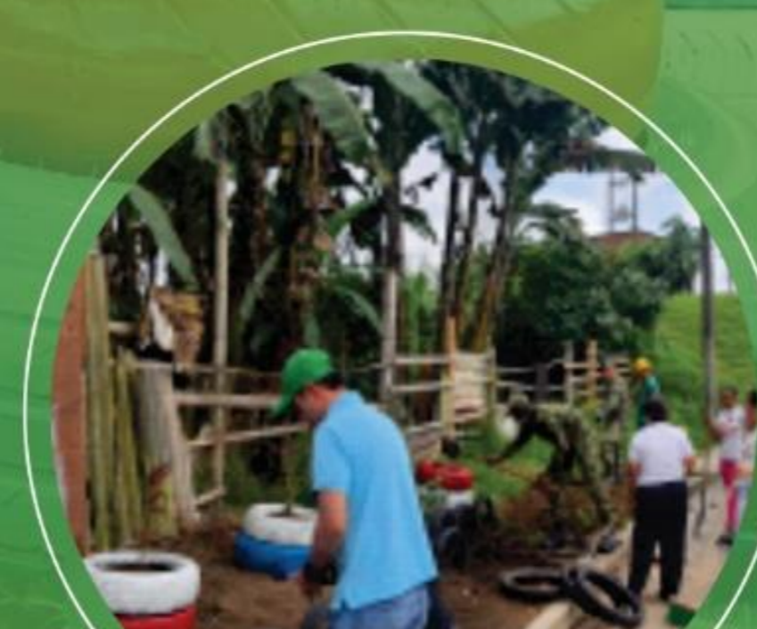
Marzo 22 Barrio Terranova el Alba