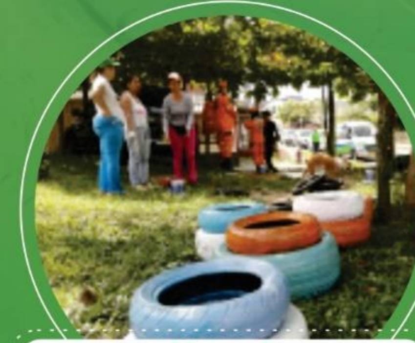
Mayo 3 Barrio Villa Alejandra