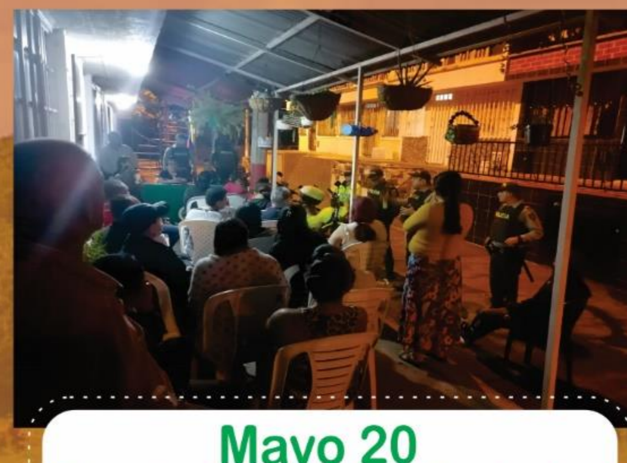
Mayo 20 Barrio Jardin de la Fachada