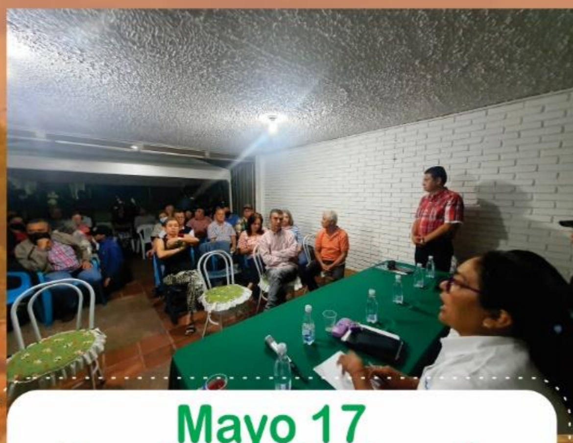
Mayo 17 Barrio Profesionales