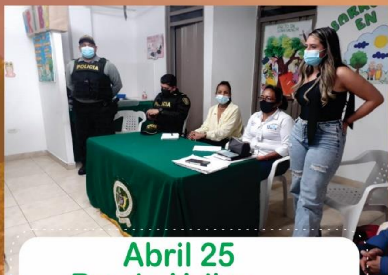
Abril 25 Barrio Uribe