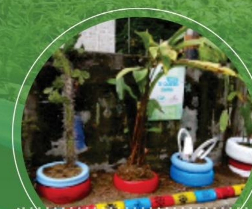
Abril 6 Barrio Villa de la Vida y el Trabajo