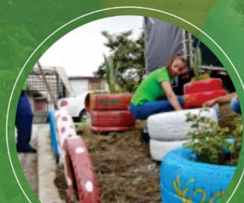
Marzo 2 Barrio la Patria