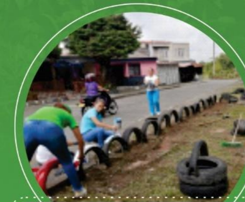
Abril 8 Barrio La Esperanza